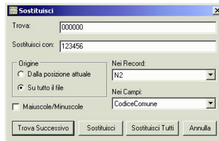
Figura 4 – Sostituzione di un valore di un campo in tutti i record

In questo caso il tempo impiegato per svolgere l'operazione sul flusso di 10 anagrafiche l'operazione è stata di 2 minuti con un unico caricamento su server.